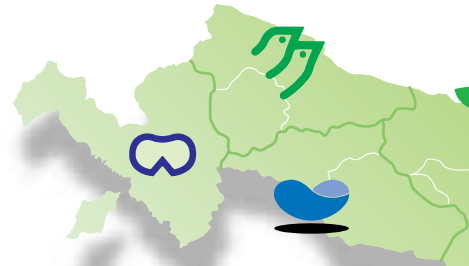
市民活動支援施設「麻生市民交流館やまゆり」