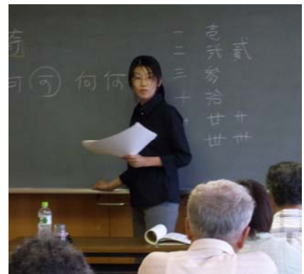
▲今年度の入門古文書講座の様子

古文書を読むための基礎はもちろん、講座終了後も自宅で個人学習ができるよう、また今回は初級古文書講座にも挑戦していけるよう丁寧に講義を進め、「古文書を読みはじめるよいきっかけとなった。」「これからも古文書を勉強していきたい。」という嬉しい感想が多く寄せられました。