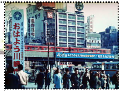
▲指定都市のスタート 京急川崎駅前（昭和47年）