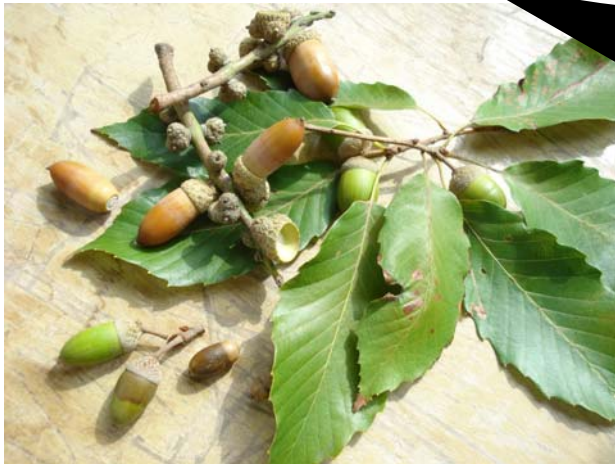
等々力緑地のどんぐりたち