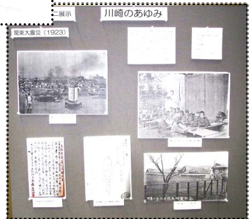
▲関東大震災直後の小学校の様子 など（大正12年）