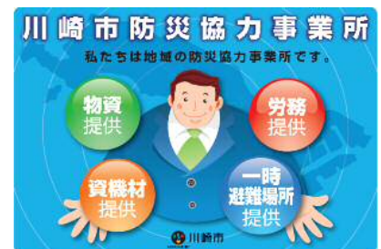
防災協力事業所のステッカー