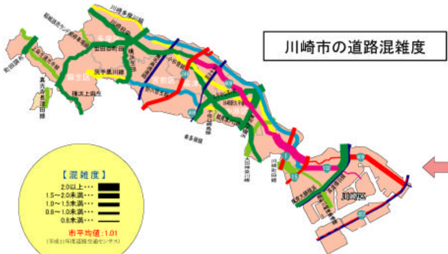
川崎市の道路混雑度