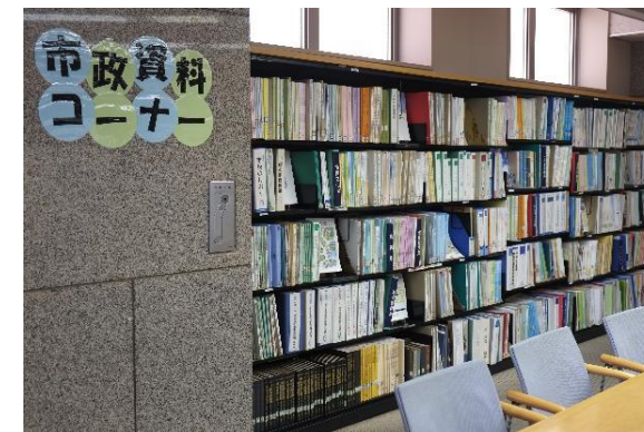
市政資料コーナー