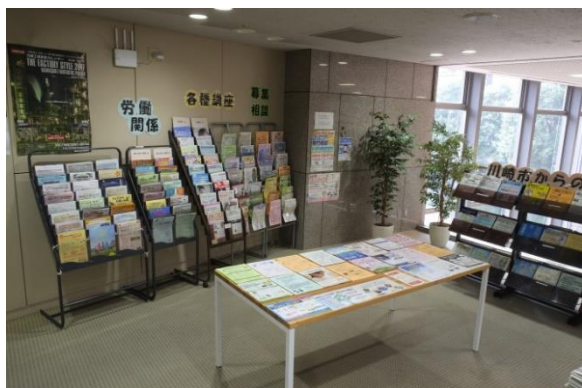
チラシ・パンフレットコーナー