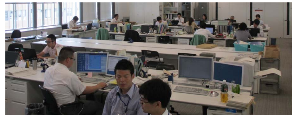
川崎市幸区役所 供用開始後 (平成27年5月)