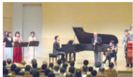
区民に身近な音楽を届けましょう

出演予定日・場所 ①8月25日(火)、昭和音楽大学ユリホール ②11月7日(土)、新百合21多目的ホール ③