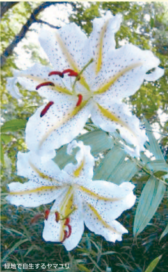
緑地で自生するヤマユリ