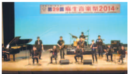
大舞台上で日ごろの成果を発表

区と共に成長してきた区民手作りの音楽祭が第30回を迎えます。コーラスの部は後日募集します。 出演予定日・場所 6月14日(日)、麻生市民館ホール(リハーサルは前日になる場合があります)