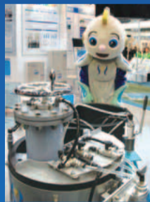
多彩な種類のろ過装置(昨年)