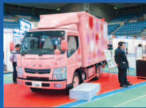
世界初の技術を搭載した低燃費の小型トラック(昨年)