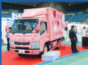
世界初の技術を搭載した低燃費の小型トラック(昨年)