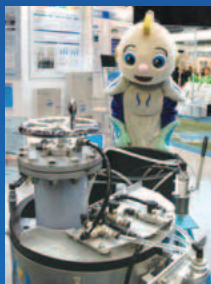
多彩な種類のろ過装置(昨年)