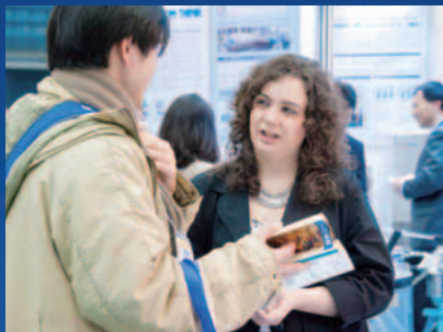
海外からも多数参加

会場では「環境改善技術」「廃棄物・リサイクル技術」「新エネ・省エネ」など、7つの分野別に環境に配慮した製品や取り組みを自由に見学できます。