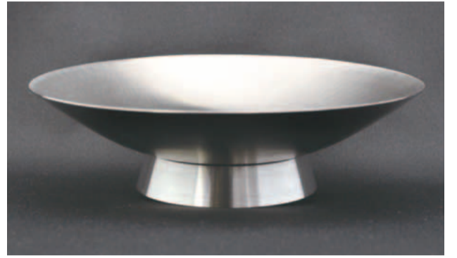
思わす息をのむ美しさの杯です

展示会に出展しました。杯は直径17㍓、高さ4.5㍓の大きさで、上部の碗と土台を溶接することなく「かしめ」という技術で接合し、一体的で美しいデザインとなっています。