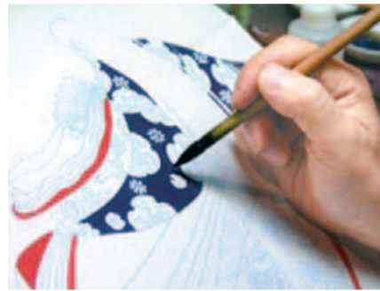
鮮やかな文様が描かれていきます

手描き友禅は友禅染本来の技法で、型紙を用いずに下絵から色挿し、仕上げまでの工程を手描きによって染め付けするものです。