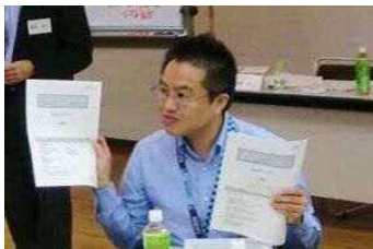
①市の職員から市の状況について説明