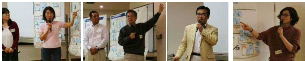
グループの代表者による発表