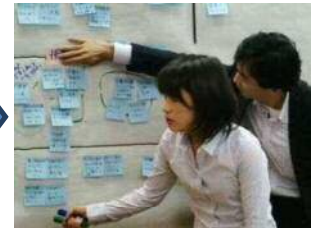
③意見を模造紙にまとめていきます