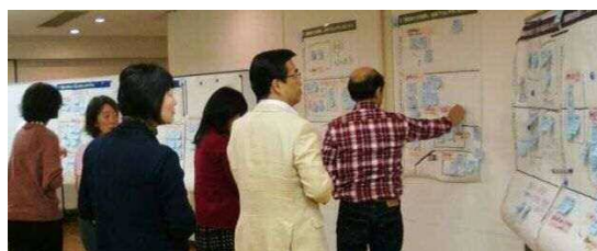
グループ発表後のシール投票