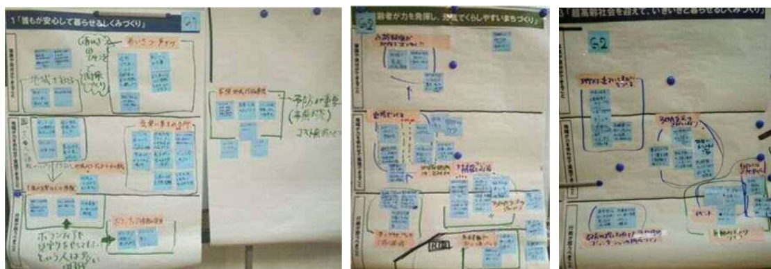
グループのまとめ

→ 本部会の成果は、第2回全体会に報告し、市民検討会議全体で共有し、話し合いに反映させます。