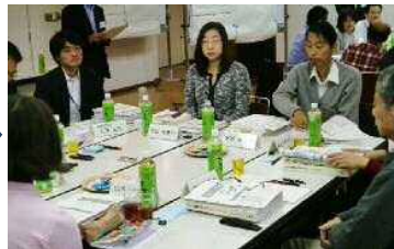
②みんなで意見を出し合います