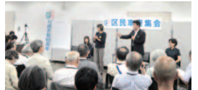
前回は活発な意見交換が行われました

FAX856-3119。[抽選]。当選者にはハガキ、FAX、メールのいずれかで通知します。傍聴は当日先着50人。保育、手話通訳あり(事前申込制)。詳細は問い合わせるか市ホームページをご覧ください。