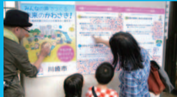
たくさんの人にシール投票をしていただきました

計画の策定に向けた基本的な考え方や策定状況をお知らせするとともに、幅広い区民の皆さんに計画づくりに参加してもらうため、地域課題と解決のアイデアを示し、共感する項目に投票していただきました。