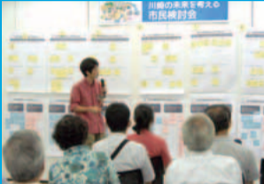
幅広い世代の人に熱心に議論いただきました