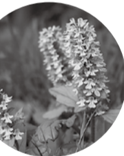
ジュウニヒトエ 花期: 4~5月