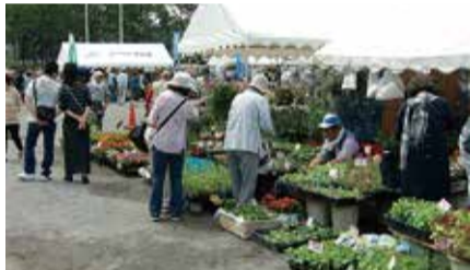
たくさんの花や植木が並びます

◎花と緑の市民フェア…5月15日(金)～17日(日)、9時～17時。花や植木などの即売会、園芸相談、市内産野菜の即売会、フラワーデザイン講習会(15日、16日、10時半～12時)、花と植木の品評会(一般観覧:15日15時～17時、16日9時～10時半、即売会:16日10時半から)、青空園芸教室(15日13時半から、16日14時から)、青空料理講習会(16日12時から)など。