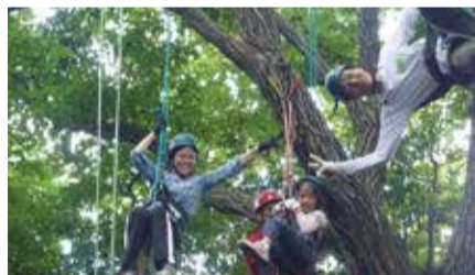
普段は見られない景色が広がるよ

子どもと一緒に専用のロープで木に登り、木の上から森を楽しみます。6月27日(土)、28日(日)、①9時半～12時②12時半～15時③14時～16時半。黒川青少年野外活動センターで。小学生と保護者、各回10組。2人1組3,600円(装備レンタル料、保険料などを含む。追加参加1人につき1,800円を加算)。雨天中止。圃5月25日(必