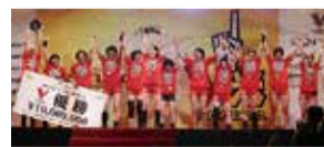
優勝に沸くメンバー JVL承認NECW-2014-012

4月4日(土)に行われた2014/15V・プレミアリーグ女子ファイナル(決勝)で、NECレッドロケッツが久光製薬スプリングスに3対1で勝利し優勝しました。圃市民・こども局市民スポーツ室 ☎200-2257、FAX200-3599