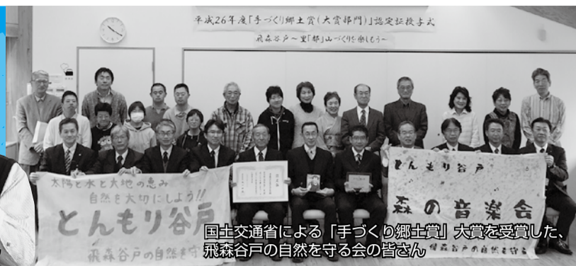
平成26年度「手づくり郷土賞(大賞部門)」認定証授与式 飛森谷戸～里「初山」山づくり会より