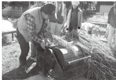
谷戸の田んぼで、子どもたちと一緒に田植えから稲刈りまで行い、収穫した米は餅つきやみそ造りに利用

そこで、荒れた飛森の里山を手入れして、昔のように子どもたちが遊べる環境を取り戻そうと、平成8年に地元有志が立ち上げたボランティアグループが「飛森谷戸の自然を守る会」です。神社跡地の開墾からスタートし、クヌギやコナラ