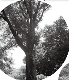
コブシ(生田小学校) /花期: 3~5月

詳細は同課、区役所で配布している冊子「川崎散歩ゆるり旅」または市ホームページをご覧ください。