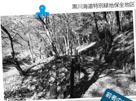
黒川海道特別緑地保全地区