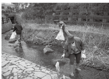
飛森川のごみ拾いなど、定期的に清掃活動も実施

の植林、湿地となっていた田んぼの再生、自然観察池の設置など、活動は広がり、メンバーも増えていきました。