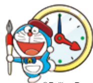
SFチケット ドラえもん

5月13日~7月6日(予定)の期間、平日16時の入館で限定特典が受けられる「SF(スペシャル・フォー)チケット」をことしも実施。特別な予約は必要ありません。通常の入館チケットを購入の上、16時回に入館した人が対象です。