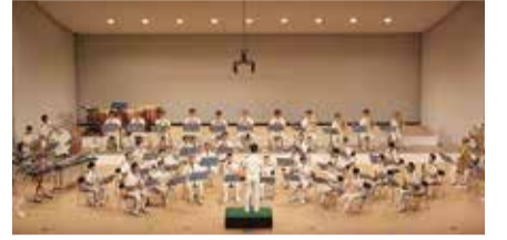
さまざまな市のイベントでも活躍中

市消防音楽隊の演奏とカラーガード隊の演技。7月4日(土)14時～16時。教育文化会館で。1,500人。圃6月7日(消印有効)までに往復ハガキに人数(2人まで)も記入し〒216-0011宮前区犬蔵1-10-2市消防音楽隊 ☎FAX975-0119。[抽選]