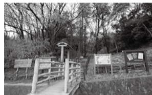
飛森谷戸では、市による整備も進められていて、周囲の自然と一体となった広場などが誕生する予定