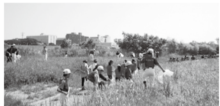
皆さんの協力で美しい多摩川に

市民・子ども局市民活動推進課 200-2479, 200-3911。区役所地域振興課。