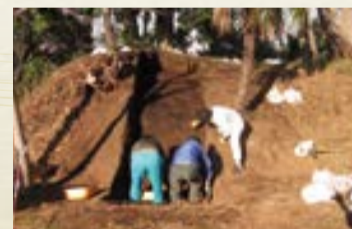
蟹ヶ谷古墳群(前方後円墳)の調査の様子