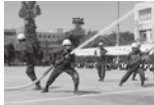
迫力満点の放水訓練の様子