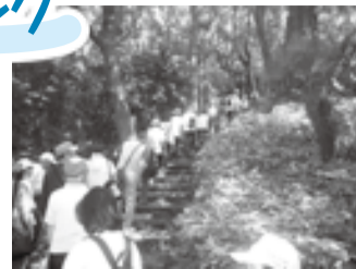
区の名所を巡りながら楽しく歩きます

コース 多摩区役所~生田緑地~五所塚~等覚院~長尾神社~妙楽寺~せせらぎ館。約7km