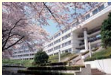
緑に囲まれた「西生田キャンパス」