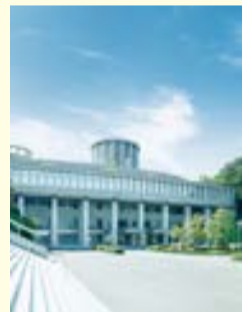
多くの学生が学ぶ「生田キャンパス」