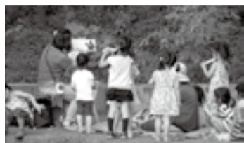
自然の中で楽しめるイベントです

場所 ①西口園路②中央広場。当日直接 生田緑地東口ビジターセンター ☎933-2300、FAX933-2055