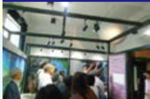
たくさんの方に参加いただき、大好評でした