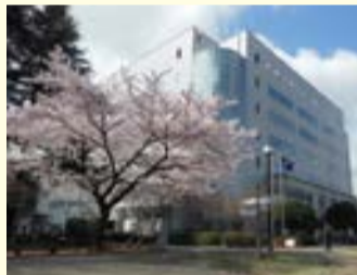
理系の研究施設が充実している「生田キャンパス」

※見学ツアーは数コース用意しています。①②と自由に組み合わせることで参加可能です。この他、黒川農場の新鮮野菜や明大グッズの販売も行います ☎明治大学生田キャンパス課 ☎934-7587、7588、FAX934-7900