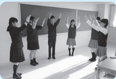
放課後に練習をしている手話コーラス。現在のレパートリーは7曲

校外の施設実習や福祉ボランティア部の活動を通じて、高齢者福祉に関わる仕事をしたいという気持ちが強くなっています。この学校を卒業すると、介護福祉士国家試験の受験資格が得られるので、資格を取得して将来その世界で活躍したいです。