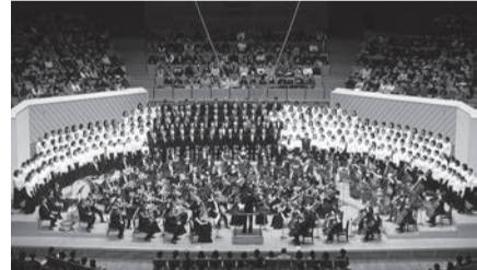
美しい歌声をミュージアムに響かせよう

練習日程…8月28日～12月18日の金曜、18時半(8月28日は17時半)～20時45分と11月23日(祝)、12月5日(土)、19日(土)(時間は未定)、全20回。中原市民館他で。対象…小学生以上(小・中学生は保護者と参加)。人数…練習に13回以上出席できる260人。費用…一般16,000円(チケット2枚付き)、高校生8,000円(チケット1