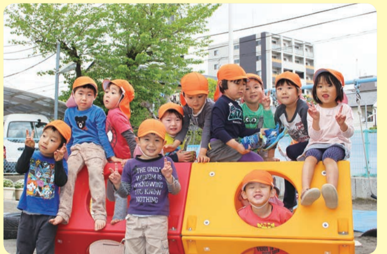
保育園では子どもたちが元気に遊んでいます