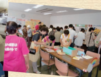
たかつ区健康福祉まつりに参加