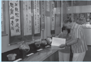
個性あふれる作品がずらり