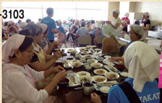
健康に配慮した料理の勉強会を開催

健康に配慮した店内環境やメニューの整備、メニューの栄養成分の表示などに取り組むお店の普及拡大の活動や、健康にいいレシピ集の作成をしています。その他、健康づくりに関する情報を提供し、意識を高めてもらうため、区と協力して「高津区健康づくりのつどい」を開催しています。このイベントでは講習会を開いたり、健康に関するチェックを受けられるようにした