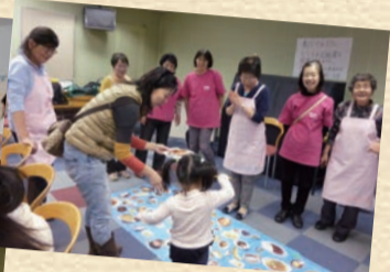
高津区子ども・子育てフェスタで「食材釣り」を出店

りしています。また、他の団体からの依頼で、健康をテーマにした料理教室の開催も行っています。