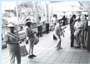
駅利用者などに啓発物を配布

日時 7月11日(土)15時～16時 場所 武蔵溝ノ口駅キラリデッキ 圏区役所危機管理担当 ☎861-3146、 FAX 861-3103