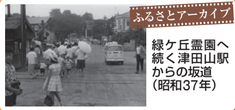
ふるさとアーカイブ