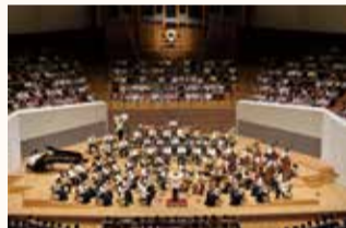
昨年のオープニングコンサート

日時：7月25日(土)15時～ 出演：東京交響楽団 曲目：マーラー／交響曲第1番「巨人」他