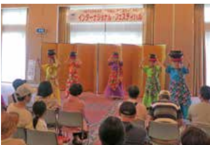
珍しいフィリピンのダンス

外国人ゲストの演奏やダンス、外国の文化体験、世界の料理・物産販売など。7月5日(日)10時～16時半。国際交流センターで。