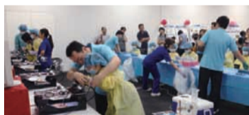
お医者さんになりきって

主に小学生を対象とした、夏休みの学習に役立つ実験が盛りだくさん。手術体験コーナー、漢方薬の中身を調べる実験など。8月4日(火)13時~16時(受け付け12時半)。川崎生命科学・環境研究センター(LiSE)他で(川崎駅東口からバス「キングスカイフロント入口」下車すぐ)。囲総合企画局臨海部国際戦略室 ☎200-2945、FAX200-3540。