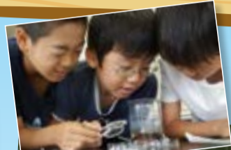
「ビオトープにはこんな生き物がいるのか〜」