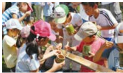
竹の中を流れるそうめんをみんなで食べよう

区内にある森を感じるイベント。竹を使用した食器作り、竹の流しそうめん、森の自然散策他。10月4日(日)9時～16時(小雨決行)。高津区市民健康の森で。小学3年生以上と保護者20組。1組1,000円(追加参加1人につき500円加算)。围園9月18日までに電話かFAXで高津総合型スポーツクラブSELF ☎833-2555、FAX833-3006。[抽選] 区役所地域振興課 ☎861-3145、FAX861-3103。