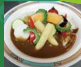
昨年度はゴーヤカレーを提供

区役所では、庁舎のエコ化の一環として、ゴーヤの育成による緑のカーテンに取り組んでいます。収穫したゴーヤを使用