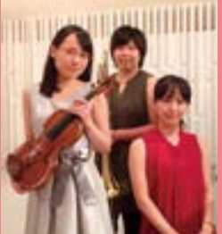
新日本BGMフィル弦管トリオ

子どもも大人も一緒に水に親しみ、多摩川の恵みを体いっぱい感じてみませんか。 日時 8月30日(日)10時~14時。受付9時~ 場所 多摩川河川敷(新二子橋下周辺) 内容 魚のつかみどり、ふれあい動物園、手作りダンボール舟、投網体験、起震車・煙体験、笹舟作りなど ☎区役所地域振興課861-3145、FAX861-3103。*雨天時などの実施の有無は当日6時半から☎0180-991213で。小雨決行