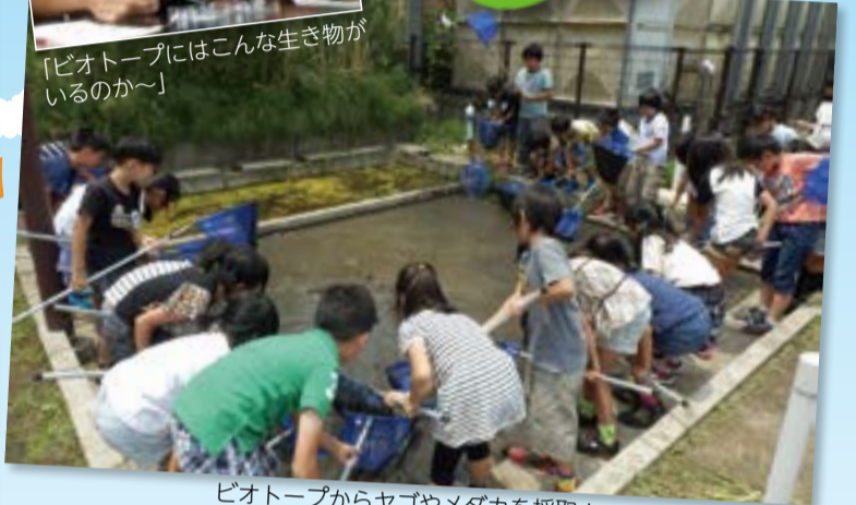
ビオトープからヤゴやメダカを採取!