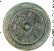
新発見の年号銘建初八年(一)のある画像鏡

東アジアで誕生し、日本で独特の発展を遂げた鏡の文化を、市内出土の三角縁神獣鏡や、初公開を含む約200面の鏡で紹介。10月10日～11月23日。一般500円、65歳以上と高校・大学生400円。