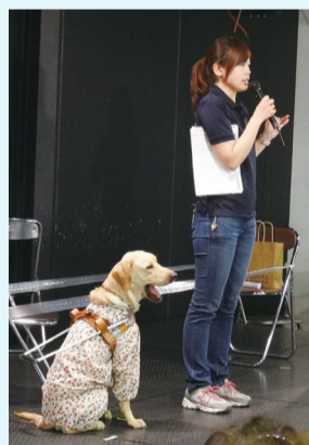
動物愛護フェア・盲導犬デモンストレーション

場所 宮前市民館・区役所 健康福祉局生活衛生課(動物愛護フェアかわさき2015実行委員会) ☎200-2449、FAX200-3927