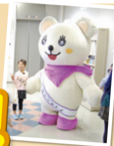
ロジーちゃんに 会えることも

区内に住んでいても「生活圏内のことしか知らない」といった声を多く耳にします。新たな商業施設ができるなど、街並みが大きく変化中、地域の商店街やコミュニティーでは、子どもも大人も楽しめる魅力的なイベントが開催されています。イベントに参加することで地域を知り、地域とのつながりを深めてみませんか。