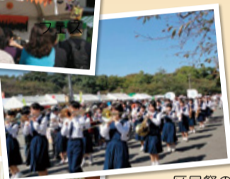
区民祭の パレード