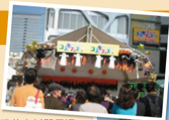
武蔵小杉駅周辺で 開催されるコスギ フェスタ

10月に入ると元住吉、新丸子、新城周辺などでは、商店街のお祭りで活気あるにぎわいを見せます。また、自然豊かな等々力緑地では、区民祭を開催。ステージ発表やパレードなどを行い、多くの区民でにぎわいます。