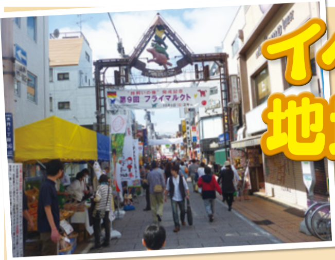
10月4日(日)に開催されるプレーメン・フライマルクト