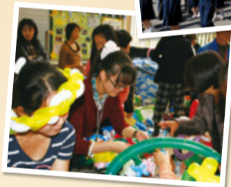
区役所ではこども 未来フェスタ が開催

イベントなどの地域情報は、なかはらメディアネットワーク情報コーナー(区版2面参照)の配布物や区ホームページをご覧ください。