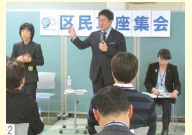
ことし2月16日に開催した幸区役所での車座集会

※当日の様子はインターネットで動画配信します。市ホームページ「市長の部屋」からアクセスしてください