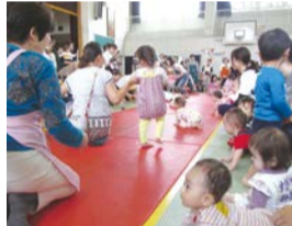
みんなでハイハイ

子育て中の保護者と子どもが、地域の人や中学生と交流します。ハイハイ・あんのつどい大会や地区ボランティアによる遊びのコーナーなど。10月1日(休)9時50分～11時半(受け付け9時半)。日吉中学校体育館で。乳幼児と保護者200組。子ども用の名札を持参。9月25日までに直接か電話で。