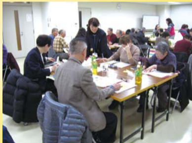
何が自分にできるか考えます

11月19日(木) 講演会「今の時代に求められる助け合い」と受講者同士の意見交換 囲碁9月15日から直接か電話で区役所高齢・障害課 ☎556-6619、FAX555-3192。 [先着順]