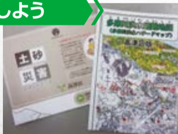
区トップページのマップ情報からクリック

日頃からハザードマップなどを活用し、危険箇所と避難する場所を確認しておきましょう。また、家族との連絡方法を確認し、持ち出し用品を準備しておくことも大切です。ハザードマップは区役所で配布している他、区ホームページからも見ることができます。