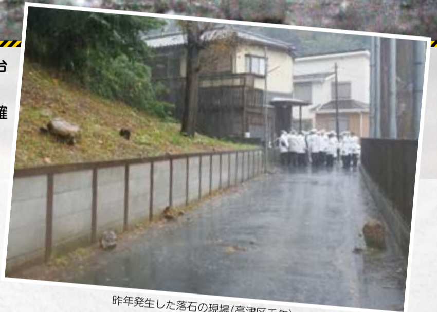
昨年発生した落石の現場(高津区千年)