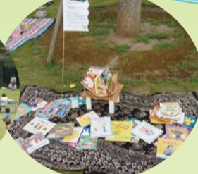
絵本を読みながらのんびり