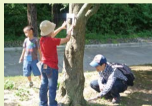
親子で楽しめます