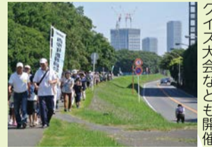
クイズ大会なども開催