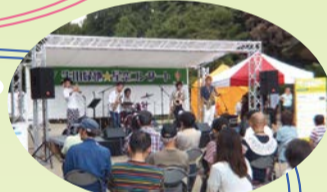
音楽を聴きながらのんびり