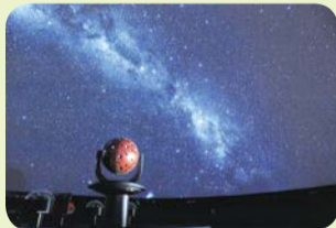
世界最高水準の美しさ

〒9月15日から電話かFAX(参加者全員の住所・氏名・年齢、代表者の電話番号を記入)で区役所地域振興課 ☎935-3132、FAX935-3391。[先着順]