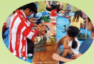
ワークショップでのんびり