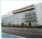
中高一貫教育校の整備