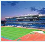
等々力陸上競技場の整備