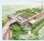
仮称リサイクルパークあさおの整備