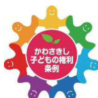
11月20日はかわさき子どもの権利の日

11月20日の「かわさき子どもの権利の日」に合わせて、子どもの権利に関する市立学校での学習や「かわさき子どもの権利の日のつどい」など、さまざまな取り組みを行っています。詳細は市ホームページをご覧ください。