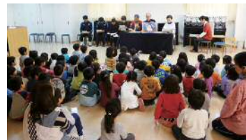
子どもと一緒に人権を考える取り組み