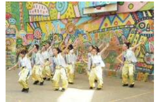
子どもたちが生き生きと輝けるまちに

いじめや児童虐待などによって子どもの権利が侵害されることのないように、市は平成13年、全国に先駆けて「川崎市子どもの権利に関する条例」を作りました。この条例には、子どもが一人の人間として大切にされ、守られながら、自分らしく生きられるようにという思いが込められています。