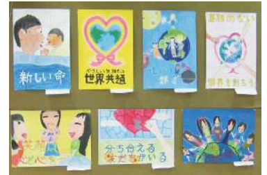
小・中学生が描いた人権ポスター

かわさき人権フェアでは、さまざまな人権問題を分かりやすく紹介します。例えば性的マイノリティの人々(男性か女性かで二分できない、あるいは同性を好きになるといった人々)に対して、無意識のうちに偏見のまなざしを向けていませんか。それら性的マイノリティの人々や犯罪被害者などの人権問題、拉致問題を紹介するパネル、中学生の人権作文などを展示します。沖縄の伝統芸能やハーモニカ演奏の舞台もあります。