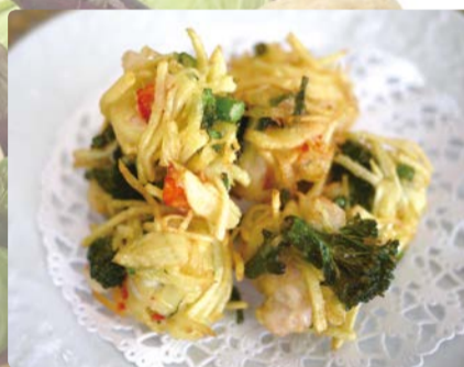
第6回グランプリ「えびのかくれんぼ」

宮前区産の野菜やくだものを使ったオリジナル料理を募集します。入賞作品はレシピブック掲載と、記念品もあります。 応募方法 12月10日までに宮前市民館などで配布中の応募用紙を直接、郵送、ファクスで。区ホームページからもダウンロードできます。 審査・選考 書類選考を通過した作品は、1月16日(土)10時～13時に市民館料理室で試食審査を行います。 園園宮前市民館 ☎888-3911、FAX856-1436