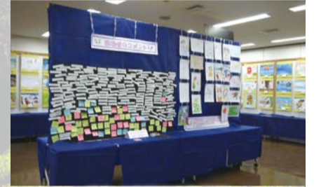
昨年の宮前地区作品展

書道、絵画など、子どもたちの作品の数々が、会場を彩ります。 宮前地区 展示 11月14日(土)13時～17時、15日(日)9時～17時、16日(月)10時～17時 表彰式 15日(日)15時～16時 場所 区役所4階大会議室 向丘地区 展示 11月14日(土)13時～16時、15日(日)9時～14時 表彰式 15日(日)10時～11時 場所 向丘小学校アリーナ