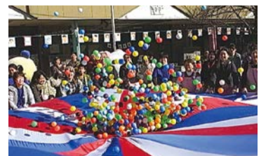
空高く舞い上がる「パラシュート遊び」はこのまつりの見どころのひとつです。

菅生中学校吹奏楽部の演奏がオープニングを飾ります。遊びのコーナーや模擬店、コンサート、パラシュート遊びなど、楽しみがいっぱい、地域の手作りのお祭りです。区PRキャラクター「宮前兄妹」も登場します。気軽に会場にお越しください。