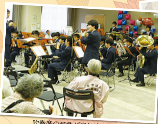
吹奏楽の音色が楽しめます