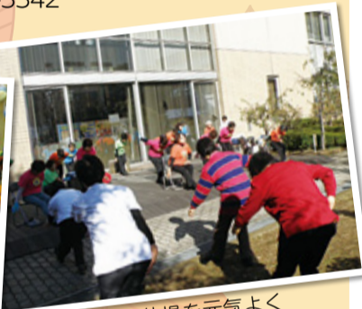
リズム体操を元気よく