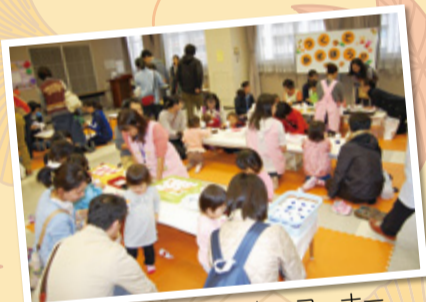
人気の手作りおもちゃコーナー

時間 10時～15時 場所 区役所5階会議室他 内容 ステージ(人形劇、チャリディング他)、おもちゃ作り、おもちゃの病院、絵本の読み聞かせ、ミニ出店コーナー、展示コーナーなど 園 区役所こども支援室 ☎744-3239、FAX 744-3196