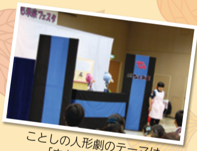
ことしの人形劇のテーマは「まちをきれいに」