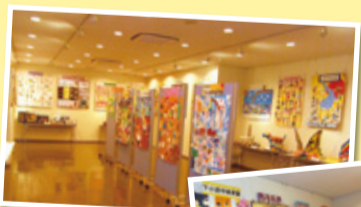
楽しい作品で心がワクワク