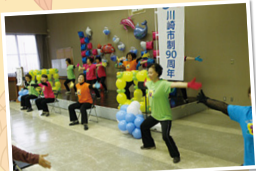
なかはらパンジー体操の体験も

時間 10時～14時 場所 区役所5階会議室他 内容 福祉健康体験ウォークラリー、福祉・健康関係団体の活動紹介と自主製品販売、バザー・模擬店、手話コーラス、パネル展示、食事バランス相談コーナー、リズム体操、ストレッチ、エクササイズ体験、コンサート 園 なかはら福祉健康まつり実行委員会事務局(区社会福祉協議会内) ☎722-5500、FAX 711-1260 区役所地域保健福祉課 ☎744-3252、FAX 744-3342