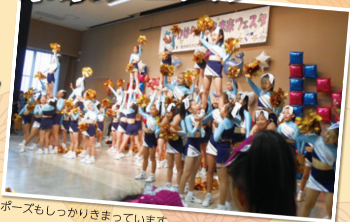
ポーズもしっかりきまっています

「きて・みて・遊んで 支え合う笑顔の輪」をテーマに、子育て中の家族が楽しく交流できるイベントです。