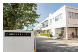
日本理化学工業 川崎工場 高津区久地2-15-10