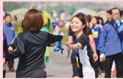
1本のたすきに思いをつなげて

部門…①ショート:4区間計10km②キッズ・ファミリー:4区間計6km③ロング:5区間計24km。☎12月18日から募集要項に付いている専用振込用紙で参加料を振り込むか、ランネットのホームページで。[先着順]。※対象は心肺機能に疾患がなく、万全の体調で参加できる人。募集要項は12月15日から区役所、市民館、スポーツセンターなどで配布。当日の参加は不可。☎多摩川リバーサイド駅伝イン川崎パンフレット発送センター☎03-3714-7924。市民・こども局市民スポーツ室☎200-3245、FAX200-3599。