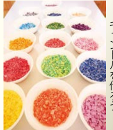
自分だけのキャンドルを作ろう