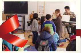
クリスマスをさらに楽しめるイベントです