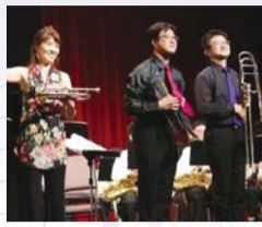
TOOT BRASS! TRIO

市内各地に出張する巡回型のコンサートが多摩区にやって来ます。 日時 12月16日(水)12時15分～13時(開場11時45分) 場所 生田中学校 特別創作活動センター 出演 TOOT BRASS! TRIO(金管三重奏) 曲名 そりすべり、讃美歌、ジョイトゥザワールド 他 定員 150人 区市民文化パートナーシップかわさき ☎FAX813-1550 ミュージア川崎シンフォニーホール ☎520-0200、FAX520-0103