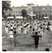
ふるさとアーカイブ 高津小学校校庭で行われたラジオ体操(昭和45年) 子どもから大人まで多くの人が参加しました。