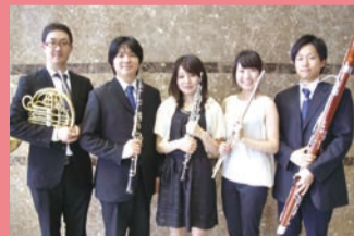
アーロム木管五重奏団

曲目 カルメンファンタジア(G.ビゼー)、北の演歌メドレー (編曲K.Miyahara)