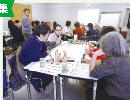
地元学「タカツガク」の開催

囲囲4月28日(必着)までに、住所、氏名、電話番号、生年月日、メールアドレス、応募理由(200字程度、書式自由)を記入し郵送かメールで〒213-8570高津区役所地域振興課(まちづくり協議会事務局) ☎861-3133、FAX861-3103、E67tisin@city.kawasaki.jp [選考]