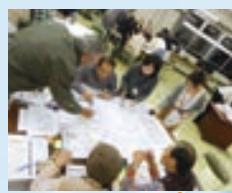
地域住民のワークショップ風景

幅広い住民を対象としたイベントや、町内会・自治会の活動紹介パンフレットの作成などを通じて、町内会・自治会の活性化を進めます。