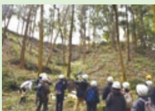
専門家と一緒に緑ヶ丘霊園内の森を観察

申込5月9日(必着)までに住所、氏名、電話番号、性別、生年月日、職業、地域での活動経験を記載した申込書(書式自由)にレポート「あなたの考える、よりよい地域の環境づくり」(800字程度)を添えて、直接か郵送で〒213-8570高津区役所企画課☎861-3132、FAX861-3103。[選考]