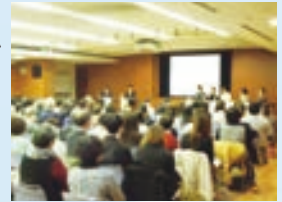
在宅医療シンポジウム

シンポジウムでの在宅医療の普及啓発や、交流会・講演会を通じた高齢者見守りネットワークの充実などにより、区民や協力事業者、関係機関が連携して、高齢者の見守り・支援体制の構築を推進します。