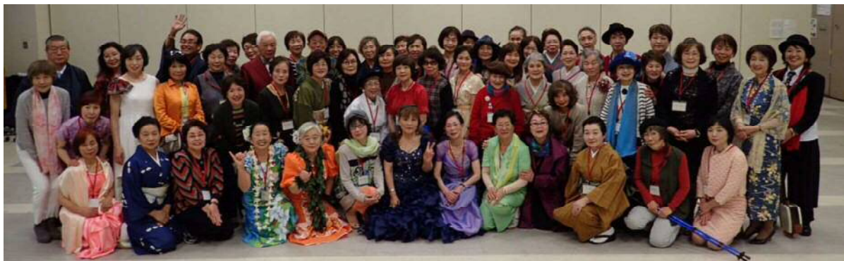
出演するみなさん