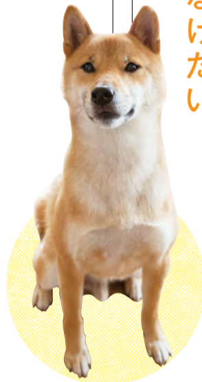
名前:大豆(オス) 年齢:推定3歳 名前の由来:動物愛護センターで「だいちゃん」と呼ばれていたから

トライアル時にはグッズなども貸し出してもらって、大豆を迎え入れる環境を整えやすく、譲り受ける際にもアドバイスをもらえました。「心配事があつたらいつでも連絡してくださいとお二人。今や、家族同然となった大豆と夫妻。温かい絆が日々、強くなっているようでした。