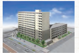
大島住宅完成予想図 ※外観の色は実物とは異なります

申し込み資格 ①市内在住か市内同一勤務先に在勤1年以上 ②一定の月収額を超えない ③住宅に困窮している、など