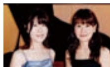
デュオ・アルディート

曲目 オペラ「カルメン」より闘牛士の歌・ハバナ他 申込 7月31日(必着)までに往復ハガキに住所、氏名、電話番号、希望人数(2人まで)を記入し〒215-8570麻生区役所地域振興課 ☎965-5116、FAX965-5201。[抽選]