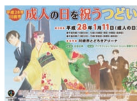
昨年度のポスターデザイン

29年1月9日(祝)に行う「成人の日を祝うつどい」のポスターデザインを募集します。採用作品は市内各所に掲示する他、パンフレットの表紙にします。優秀作品には副賞あり。詳細は市ホームページをご覧ください。市こくほ・こうきコールセンター ☎982-0783。区役所保険年金課、支所区民センター保険年金係。8月19日までにエントリーシート、見積書などの必要書類を直接、区役所危機管理担当、支所区民センター地域振興係、出張所。市市民文化局地域安全推進課 ☎200-2284、FAX 200-3869。※エントリーシートを希望する団体はお問い合わせください。