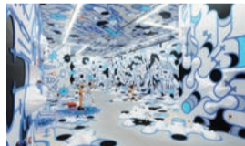
パラモデル「パラモデルック・グラフィティ」

鉄道のテイストを作品に取り入れながら遊びの空間を創造する現代アーティストの作品展示、列車の映像、ミニSL乗車体験など、遊びを通じて子どもから大人まで鉄道を楽しめる展覧会です。7月16日～10月10日。要観覧料。