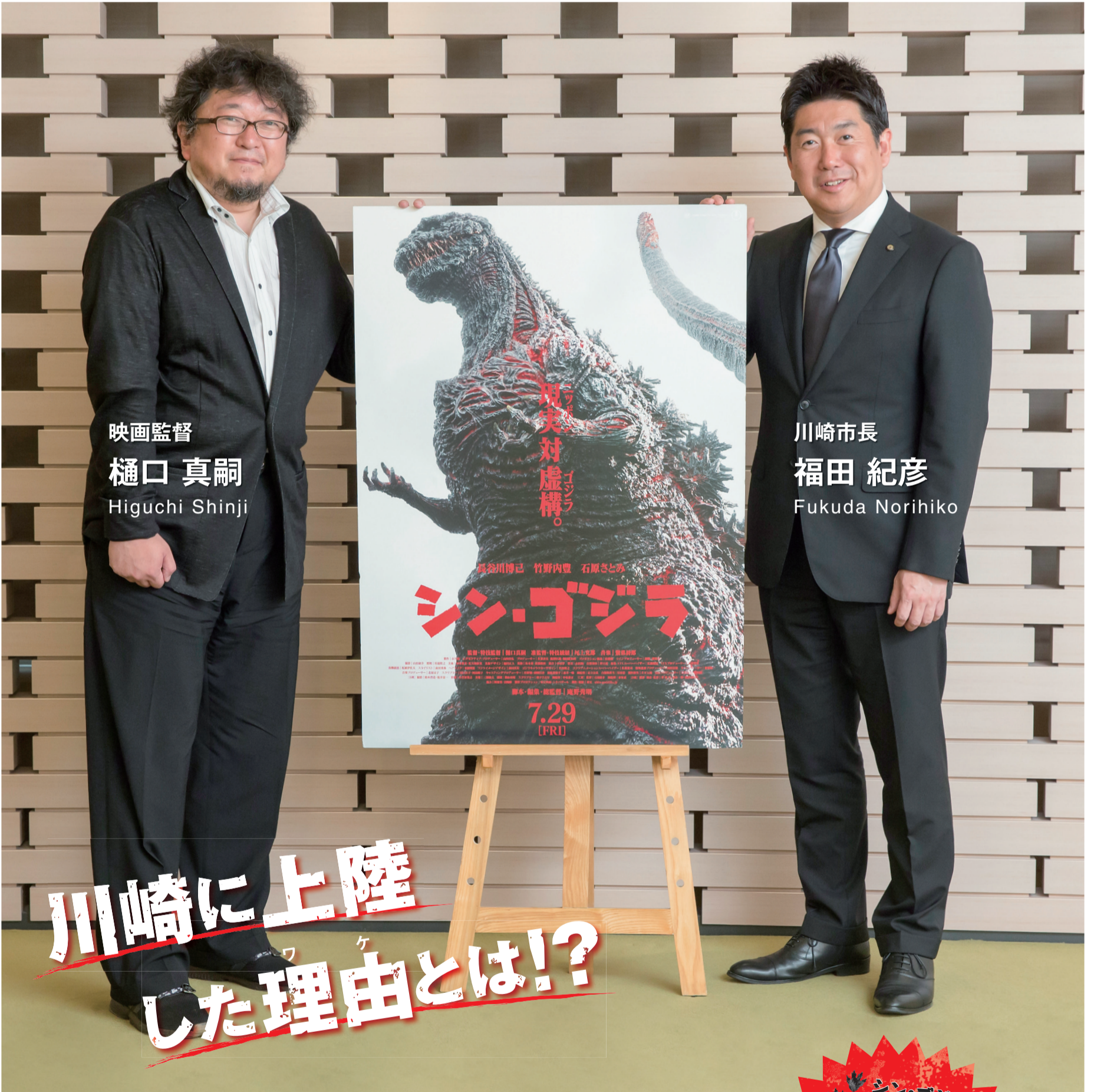
映画監督 樋口 真嗣 Higuchi Shinji