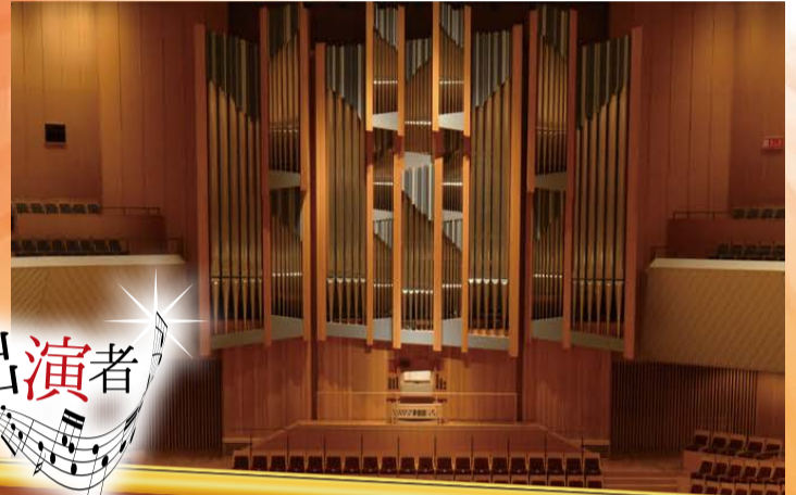
多彩な音を奏でる日本最大級のパイプオルガン