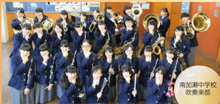
南加瀬中学校 吹奏楽部