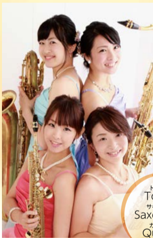
トルチエイ Tortuei サクソフォン カルテット Quartet