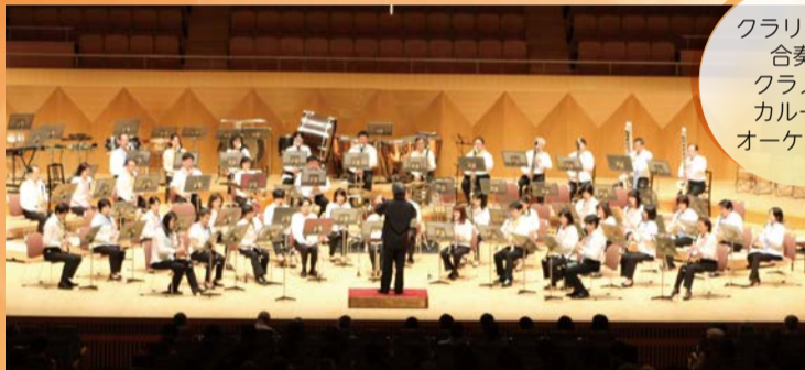
クラリネット 合奏団 クラノワ・ カルーク・ オーケストラ