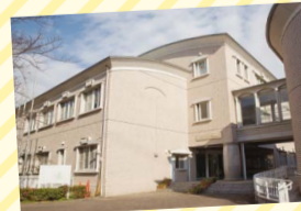
落ち着いた環境で3年間学ぶ