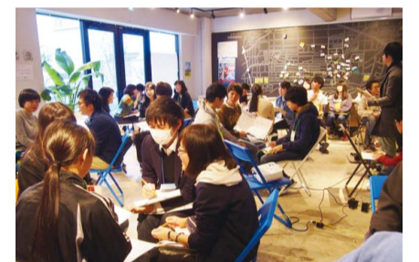
プロジェクトを考える高校生たち

自分たちの街をより良く変えていくための高校生によるプロジェクトの成果発表会。2月5日(日)13時～15時。市役所第4庁舎で。事前申込制。囲2月3日までに電話かホームページで川崎ワカモノ未来PROJECT ☎ 200-2094、FAX 200-3800。囲市民文化局協働・連携推進課 ☎ 200-2094、FAX 200-3800。※詳細は区役所、市民館などで配布中のチラシか市ホームページをご覧ください。