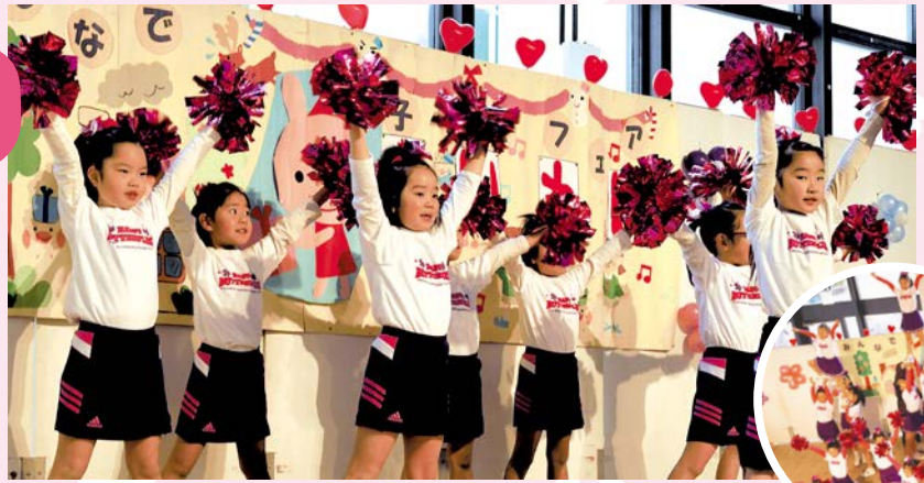
昨年のオープニングセレモニーの様子