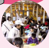
青少年指導員が指導します