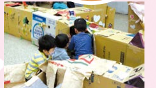
ダンボールの街であそぼう