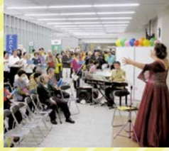
音楽、芸術、環境、防災などさまざまな分野の市民団体が参加します