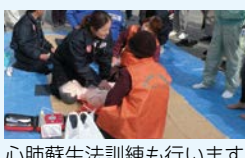
心肺蘇生法訓練も行います