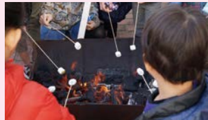
焼きマシュマロ体験も