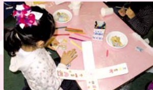
つくってあそぼう