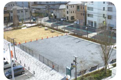
「ゆめ広場」の芝生は、等々力第1サッカー場から移植しました

区民の皆さんの憩いの場、幸区役所「ゆめ広場」の芝生スペースを3月21日から開放します。芝生の上で体操や散歩などを楽しみませんか。