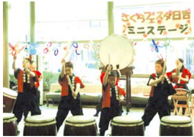
楽しい催し盛りだくさん

日吉分館で活動している団体の歌や演奏、料理屋台の出店など、魅力いっぱいのお祭りです。ぜひお越しください。