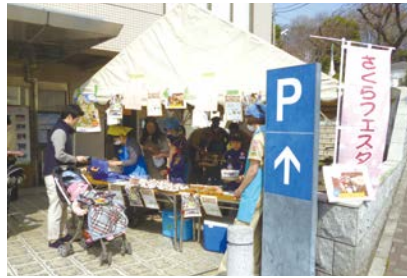
おいしい食べ物もあります