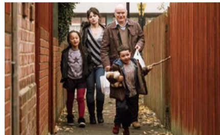
『わたしは、ダニエル・ブレイク』

日~5月12日。『ヨーヨー・マと旅するシルクロード』…5月6日~12日。『汚れたミルク/あるセールスマンの告発』…5月6日~5月19日。*日曜最終回と月曜(祝日の場合翌日に振替)は休映。