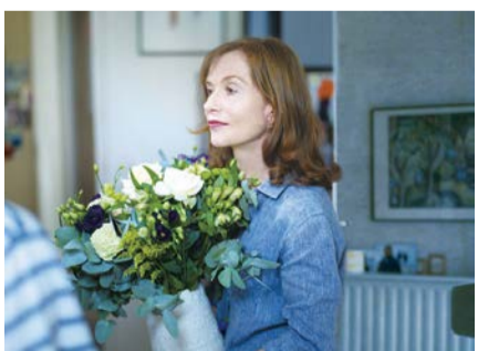
「未来よ こんにちは」 ©2016 CG Cinema-Arte France Cinema-DetailFilm-Rhone-Alpes Cinema

「サラエヴォの銃声」…5月13日～19日。「未来よ こんにちは」[家族の肖像 デジタル完全修復版]「モン・ロワ 愛を巡るそれぞれの理由」…5月