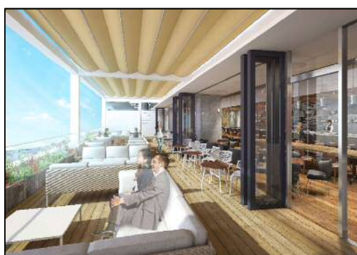
《テラスレストラン (イメージ)》

客室 : 約200室(2～5階) 料飲 : テラスレストラン(5階)、カフェ・ビジネスラウンジ(1階) その他 : カンファレンス(1階)、ライフスタイルストア(1階) 大浴場・フィットネス(2階)