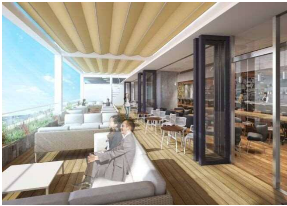
《テラスレストラン（イメージ）》