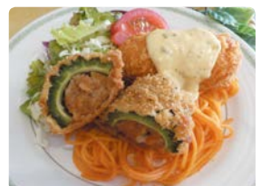
ゴーヤーの肉詰め

区役所では、庁舎のエコ化の一環として、ゴーヤーなどによる緑のカーテンに取り組んでいます。収穫したゴーヤーは区役所5階の「レストランたかつ」で提供予定です。ぜひ、区役所で採れたゴーヤーを味わいに来てください。