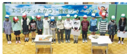
橘小学校による発表

学校流域プロジェクトでの環境学習成果の発表や地球温暖化適応策に関する講演会などを行っています。今年度は12月3日(日)に開催する予定です。