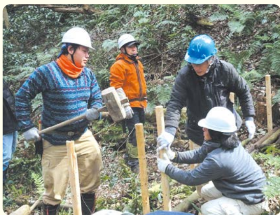
カンツリーヘッジを製作中!

緑ヶ丘霊園の森の一部では、生い茂った常緑樹で日光が届きづらく、下草が少なくなっています。下草が少ないと雨が地面に直接当たり、土が流れやすくなります。そこで、緑ヶ丘霊園内の森をモデル地区として、生い茂った木の間伐をすることで森の保水力を高め、土砂災害が起きにくい環境をつくるという適応策を進めています。また、湧水の整備も行い、「エコたかの森」として再生しています。