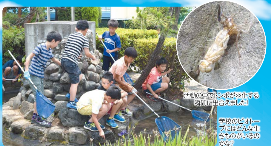
活動の中でトンボが羽化する瞬間に出会えました!