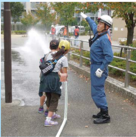
消火訓練(ホースキット)

時間 9時半～12時半(荒天中止) 場所 王禅寺ふるさと公園 内容 消火訓練、一次救命・応急救護、仮設トイレ組み立て、応急給水訓練、防災キャンプ、防災啓発展示など 問 区役所危機管理担当 ☎965-5115 FAX965-5201 【当日実施案内】0120-910-174(無料)※携帯電話不可 044-245-8870(有料)