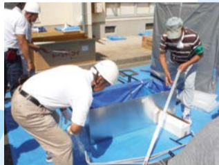
仮設トイレ組み立て訓練