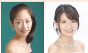
ピアノ・デュオ・ソフィア

曲目 モーツァルト作曲 4手のためのピアノソナタ 二長調K.381、ヨハン・シュトラウス作曲「春の声」他