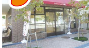
障害者施設と地区会館を合築した「まじわーる宮前」には、バーカリーカフェがあります