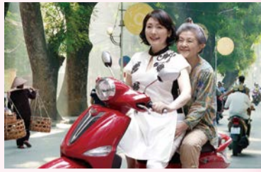
◎「ベトナムの風に吹かれて」製作委員会