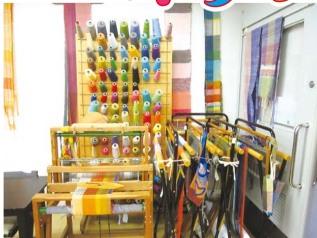
世界にひとつだけの作品がここから生まれます(長尾けやきの里)