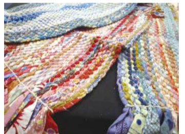
思い思いの布で織られるマット。それぞれのペースで完成させます(あーる工房)