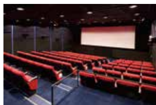
川崎市アートセンター

The City of Kawasaki invites citizens actively engaged in fields of culture, arts and sports to become the Cultural Envoys of Kawasaki and work in cooperation with the promotion of a positive image for the city both in Japan and abroad. Duties of a Cultural Envoy involve delegation visits to the City of Kawasaki's domestic and international Sister and Friendship Cities for exchange activities and cultural events. In addition, the City seeks recommendations and proposals from the Cultural Envoys to further the promotion of culture.