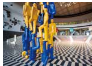
川崎市市民ミュージアム