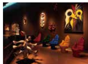
川崎市岡本太郎美術館