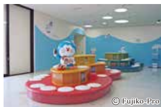
川崎市藤子・F・不二雄ミュージアム